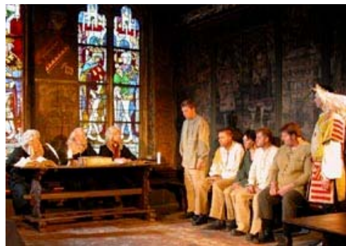
Der Prozess um Nickel List wurde fürs Fernsehen in der Gerichtslaube des Rathauses nachgestellt.

Er lernt Latein, studiert als Autodidakt, erwirbt medizinische Kenntnisse und stellt Rezepte aus. In einer Zeit zwischen Aberglauben und Aufklärung bleibt er den Bürgern von Beutha,