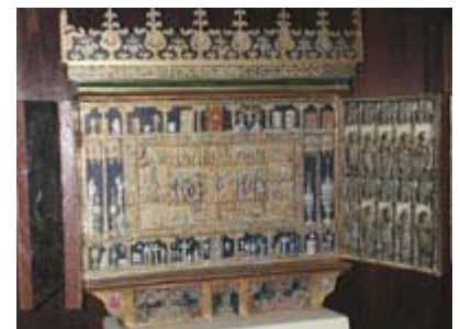
Die Kopie der Goldenen Tafel steht in St. Michaelis