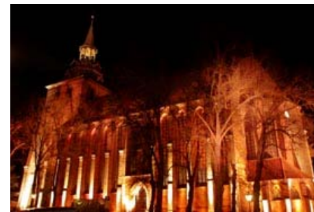
St. Michaelis bei Nacht: Hier raubte List die Goldene Tafel