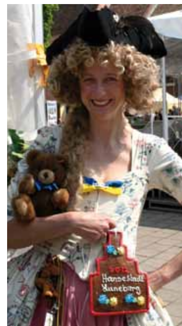
Hanse tag 2012 Flyer III - Lüneburg - August 2011 - epos-design - Fotos: Joachim Scheunemann und Erhard Polzin